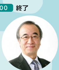
花角 英世 さん 新潟県知事