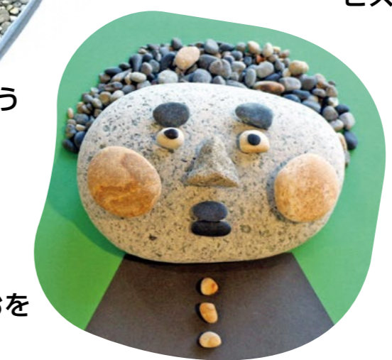
石のかおを作ろう