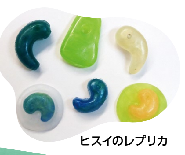
ヒスイのレプリカ