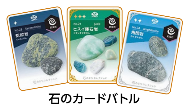
石のカードバトル